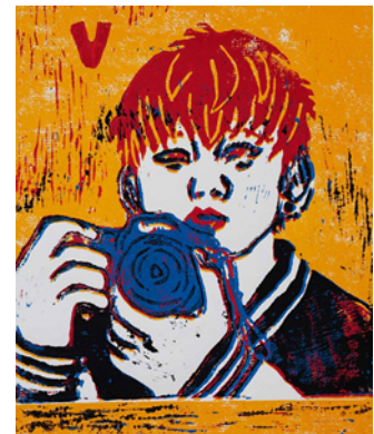
Viktoria Zyzik, Differenzierungskurs Klasse 8, mehrfarbiger Linoldruck