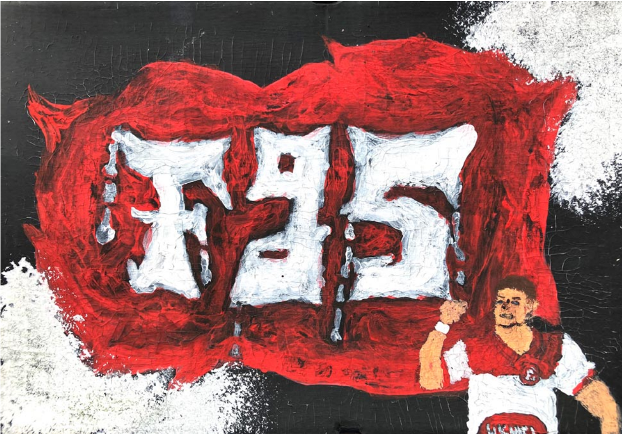
Eric Kerschgen · Differenzierungskurs Kl. 8 „Fortuna Olé“ Gouache aif Karton

Ophelia Greub · Marinus Düsterhus · Martin Rothweiler