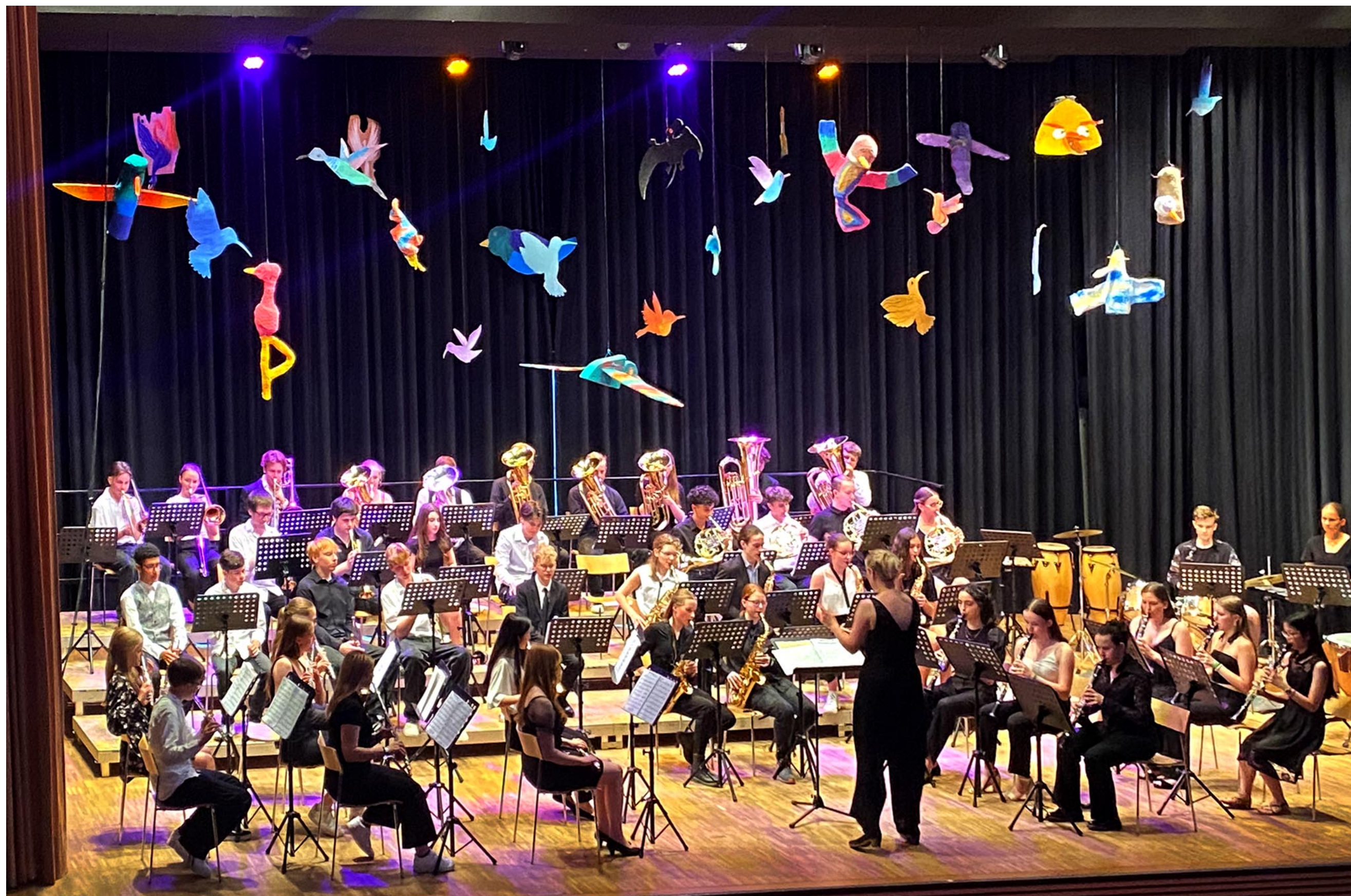
Klasse 5c, 5e und 6d Gruppenarbeit „Bühnenbild für ein Konzert“ Pappe, Pappmaché, Draht und Farbe